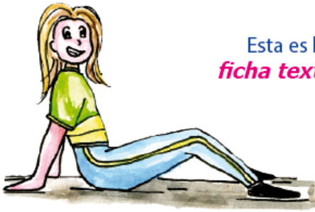
Esta es la ficha textual .