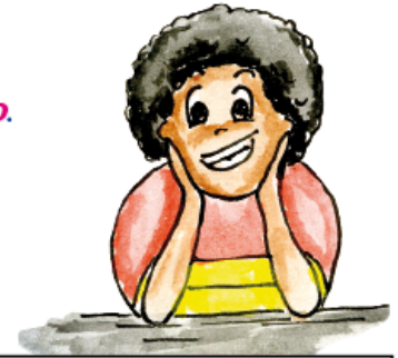
Esta es la ficha de comentario .