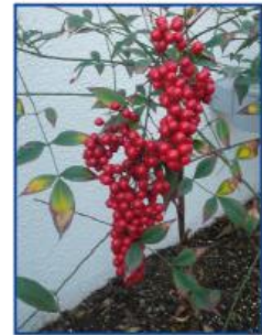
El grano de cafeto