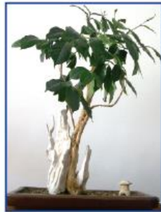
La planta del cafeto