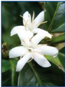
La flor del cafeto

Los cafetos son arbustos con tallos que miden dos o tres metros de altura. Tienen hojas perennes, de un bonito color verde brillante; que crecen en pares opuestos a lo largo del tallo. Las flores blancas, con un delicioso aroma de jazmín, se agrupan en la base de las hojas, formando glomérulos florales de ocho a quince flores. Los frutos que son verdes primero, demoran entre ocho y doce meses en madurar, y van pasando del amarillo al rojo escarlata. Por eso, estos frutos reciben a veces el nombre de cerezas.