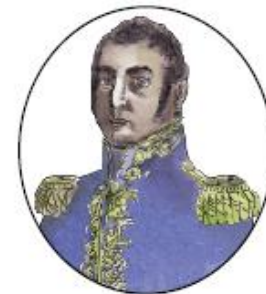
José de San Martín

III. Piensa y responde, ¿a cuál de estos personajes desearías imitar y por qué?