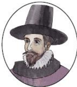
El virrey Toledo