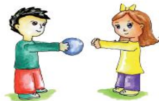
Eliges con quién jugar.