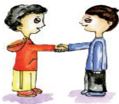
Eliges a tus amigos.