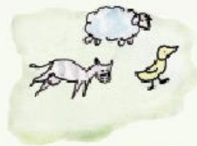
animalitos de plástico