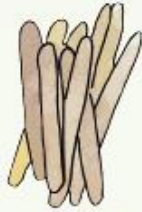
palitos de chupete